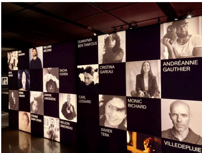
Les différents photographes qui tiennent la vedette de cette exposition.

Les tribunes pour se faire valoir ne sont pas si nombreuses au Québec? Qu'à cela ne tienne, le talent d'ici est assez grand pour rayonner dans le monde!