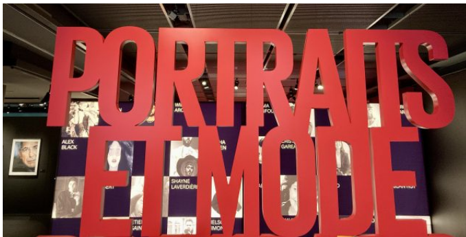
L'exposition Portraits et mode. Photographes du Québec au-delà des frontières témoigne du talent incroyable qu'il y a derrière les lentilles de chez nous.